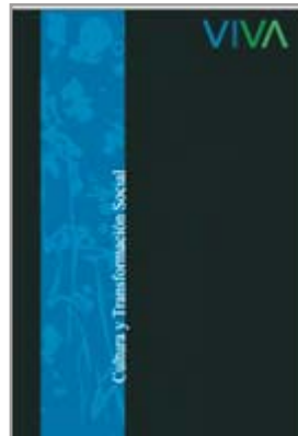
Cultura y Transformación Social Diseño, Edición y Distribución mundial