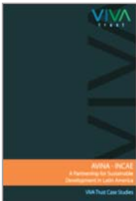
VIVA Trust Case Studies Diseño, Edición y Distribución mundial