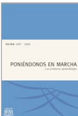
Pioneros (AVINA 1997 - 2000) Diseño, Edición y Distribución mundial