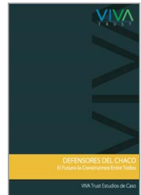
VIVA Trust Case Studies Diseño, Edición y Distribución mundial