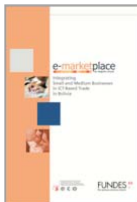
SECO e-marketplace Diseño, Edición y Distribución mundial