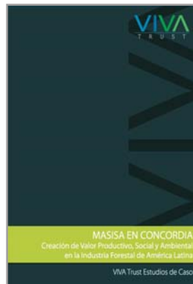
VIVA Trust Case Studies Diseño, Edición y Distribución mundial