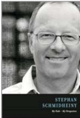
My Path - My Perspective Diseño, Edición y Distribución mundial